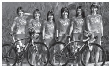
Ready Go JAPAN